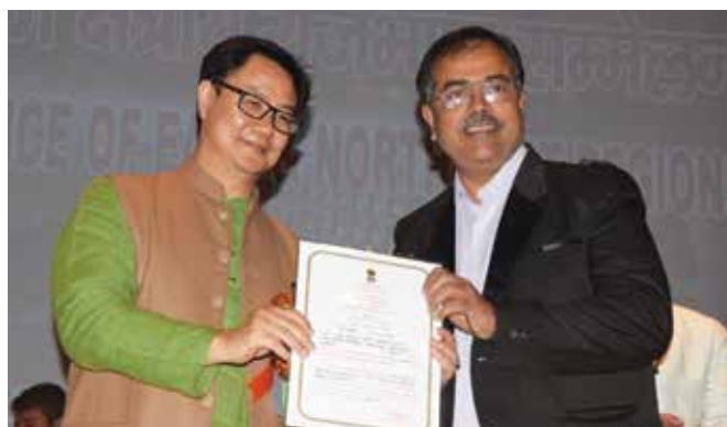
Shri N Sharma, M(OL), OIL receiving Commendation Letter from Union Minister of State for Home Affairs, Shri Kiren Rijuju.