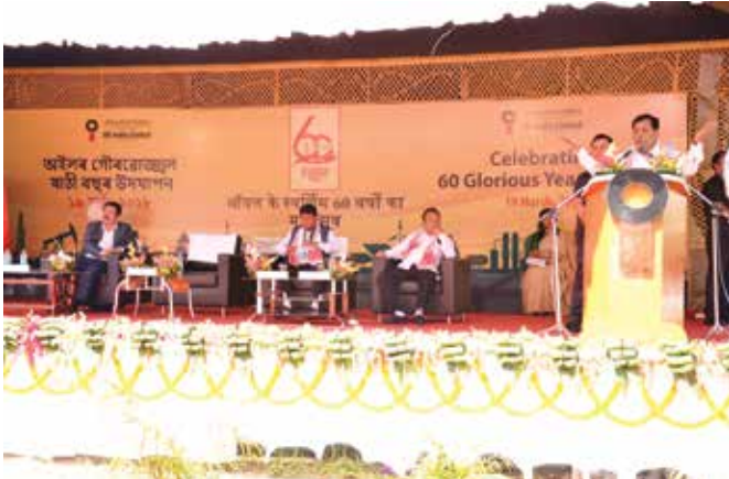
Chief Guest, Shri Sarbananda Sonowal, Hon'ble Chief Minister, Assam addressing at NHK 1 Function

Oil India Limited at its Field Head Quarter, Duliajan organized commemorative function to celebrate its 60 glorious year at Naharakatiya Well No. 1 and Project Rupantar Credit Disbursement function at Bihutoli, Duliajan on 19th March, 2018.