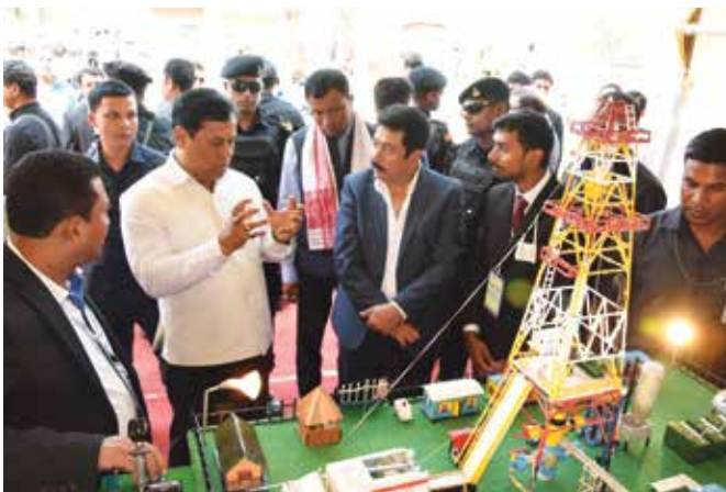
Hon'ble CM at the exhibition venue at NHK 1 Function