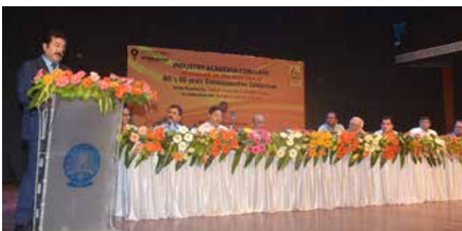
Shri Utpal Bora, CMD, OIL addressing the gathering