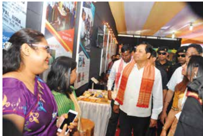
Hon'ble CM at the CSR exhibition

After the inauguration, Hon'ble Chief Minister along with other dignitaries ceremoniously handed over the assistances under project Rupantar to the beneficiaries. As a part of the ongoing CSR Project of OIL 'Rupantar' for creating avenues for sustainable self-employment for development of agro