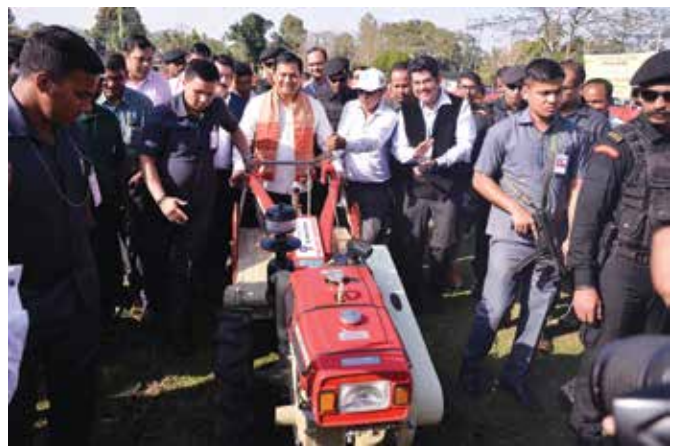
Hon'ble CM tries his hands on a power tiller to be given away under project Rupantar