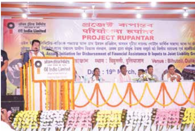
Shri Utpal Bora, CMD, OIL addressing the gathering at Bihutoli