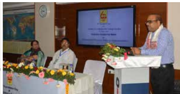
Address by Dean-(R&D) IIT-Guwahati