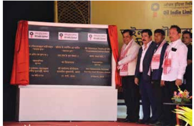
Hon'ble CM along with other dignitaries laying the foundation of the commemorative gate

The dignitaries initially graced the function at heritage NHK Well No 1 where Shri Sarbananda Sonowal, Hon'ble Chief Minister, Assam laid the foundation of the 60 years' commemorative gate followed by visit to the exhibition area at the venue and plantation of saplings. Award of excellence 'HOPE' Awards were also given away by CMD, OIL to the OIL employees under seven categories. "60 years ago, Oil India Limited started its journey from Naharkatia oil well No. 1 in Dibrugarh district of Assam. Over the years, OIL has made significant contribution to the growth of the state. It