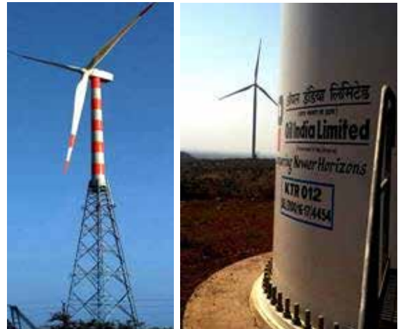
ऑयल की 52.5 मेगावाट पवन ऊर्जा परियोजना का कार्यस्थल

यह परियोजना पूरी तरह से ऑयल द्वारा वित्त पोषित है। संचालन तथा रखरखाव का काम मैसर्स सुजलॉन एनर्जी लिमिटेड (SEL), दिल्ली द्वारा किया जाएगा जो परियोजना के विकसितकर्ता भी है। इसके साथ ही, नवीकरणीय ऊर्जा डोमेन (व्यवसायिक पवन ऊर्जा तथा सौर ऊर्जा परियोजनाओं) के तहत ऑयल की वर्तमान स्थापित क्षमता 188.1 मेगावाट हो गयी है जिसमें क्रमशः पवन ऊर्जा परियोजना 174.1 मेगावाट तथा सौर ऊर्जा परियोजना 14 मेगावाट है।