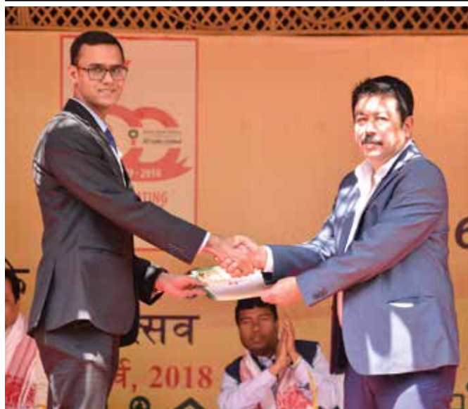
Young Executive of the Year

PROFESSIONAL OF THE YEAR: (Grade A to G)