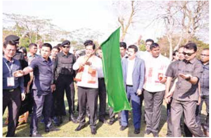
Chief Guest, Shri Sarbananda Sonowal, Hon'ble Chief Minister, Assam flagging off the carrier vans at Bihutoli