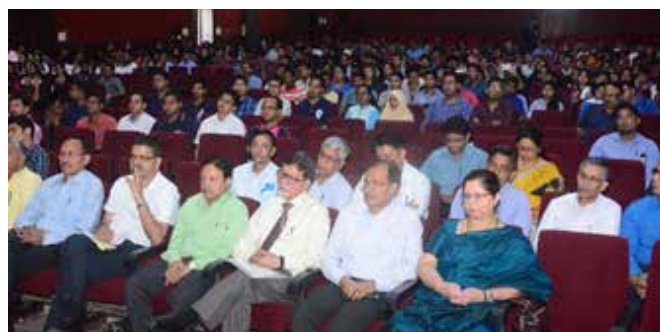
Senior officials from the Industry and the Academia attending the session