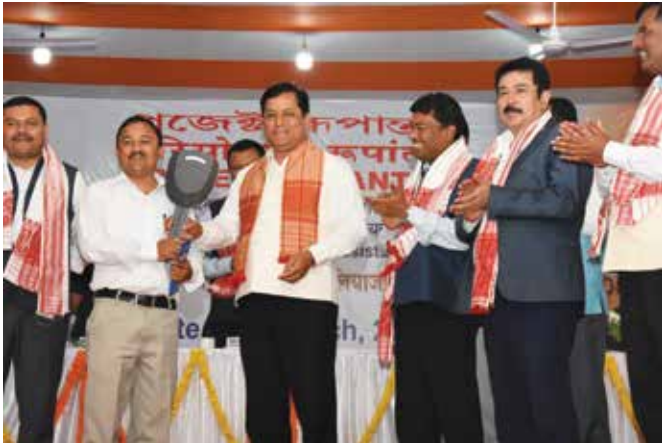
Chief Guest Shri Sarbananda Sonowal, Hon'ble Chief Minister, Assam handing over assistance to a beneficiary

Since 2008 OIL has exclusively formed 2850 SHGs/JLGs to which the Company has extended 50 % subsidy, other financial and material inputs.