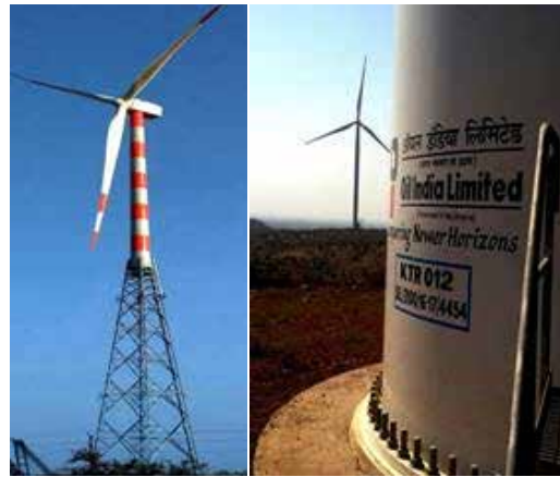
Project Sites of OIL's 52.5MW Wind Energy Project

The Project is fully funded by OIL. The Operation & Maintenance will be done by M/s Suzlon Energy Limited (SEL), Delhi who were also the Project Developers. With this, OIL's present installed capacity under the Renewable Energy domain (Commercial Wind Energy and Solar Energy projects) stands at an impressive 188.1 MW with 174.1MW of Wind Energy Projects and 14MW of Solar Energy Projects respectively.