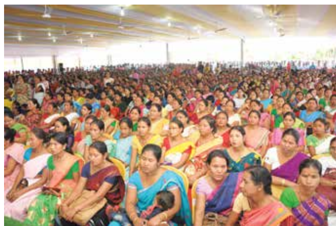
Beneficiaries attending the Rupantar function at Bihutoli

Shri Sarbananda Sonowal, Hon'ble Chief Minister, Assam in