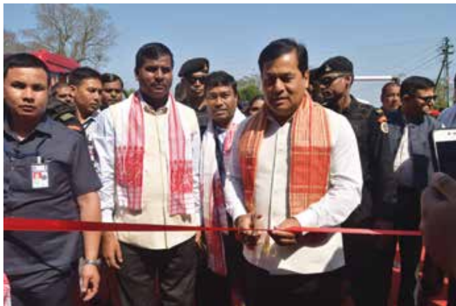
Hon'ble CM inaugurating CSR exhibition at Bihutoli, Duliajan

The dignitaries then visited OIL's Project Rupantar Credit Disbursement function at Bihutoli, Duliajan. Shri Sonowal inaugurated the exhibition Stall that displayed a wide gamut of OIL's CSR projects, showcased the social sector interventions and its success stories.