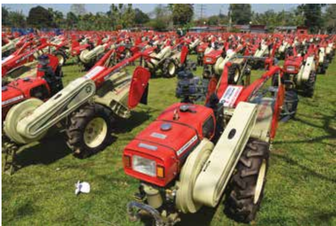
Power tillers lined up under project Rupantar