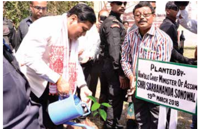
Hon'ble CM planting a tree sapling at NHK 1

The dignitaries initially graced the function at heritage NHK Well No 1 where Shri Sarbananda Sonowal, Hon'ble Chief Minister, Assam laid the foundation of the 60 years' commemorative gate followed by visit to the exhibition area at the venue and plantation of saplings. Award of excellence 'HOPE' Awards were also given away by CMD, OIL to the OIL employees under seven categories. "60 years ago, Oil India Limited started its journey from Naharkatia oil well No. 1 in Dibrugarh district of Assam. Over the years, OIL has made significant contribution to the growth of the state. It