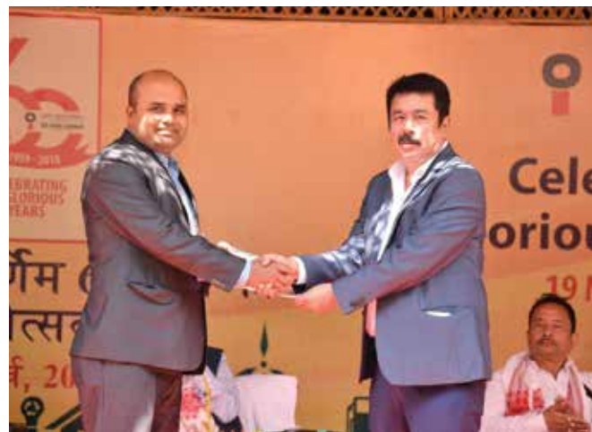
Professional of the Year