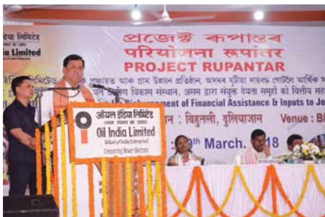
Hon'ble CM addressing at the Rupantar Function