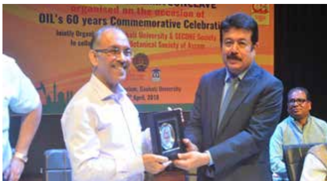
Felicitating the dignitaries with memento commemorating OIL's 60 years